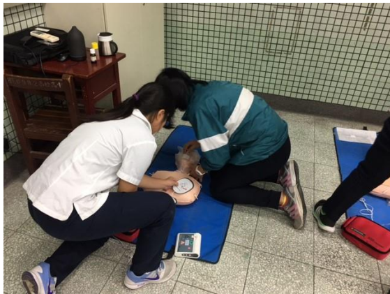
倆倆一組共同學習急救