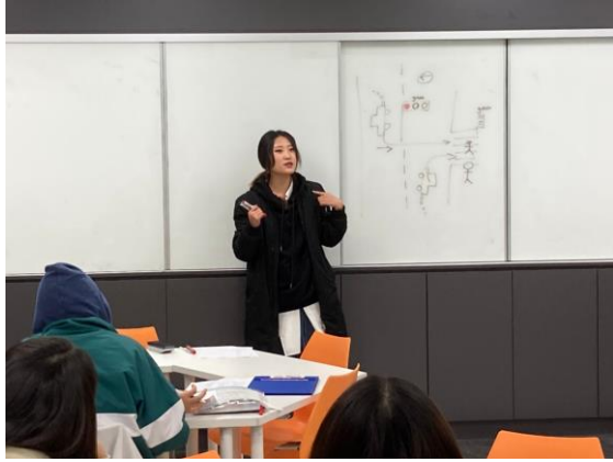
韓文老師介紹韓國交通