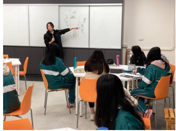
韓文老師介紹韓國交通