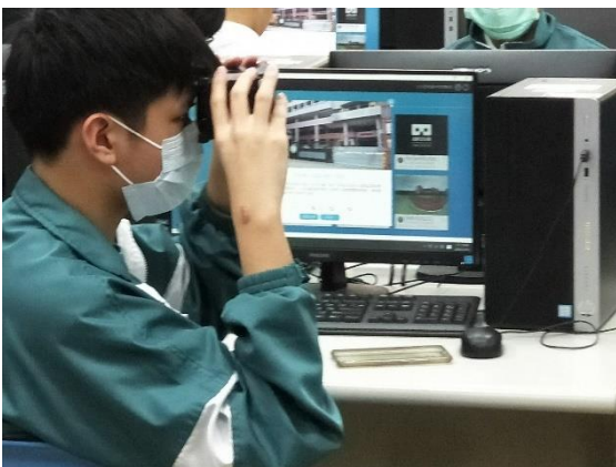
同學體驗 VR 實境