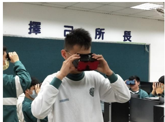
同學體驗 VR 實境