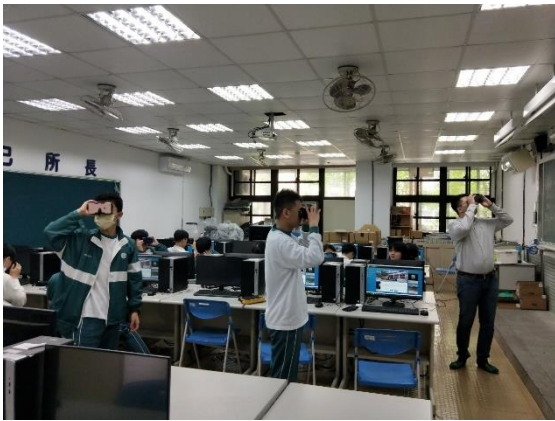
老師與同學示範 VR 使用