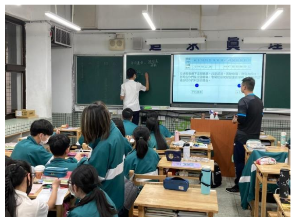
同學上台分享小組心得