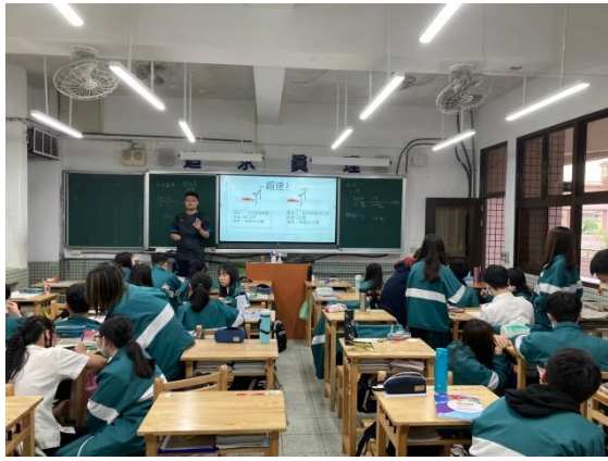
老師講解課程內容