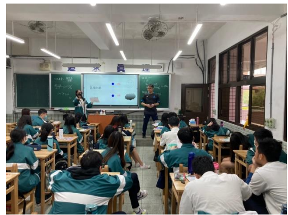
同學上台分享小組心得