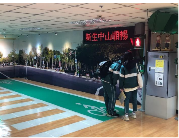
同學認識道路安全