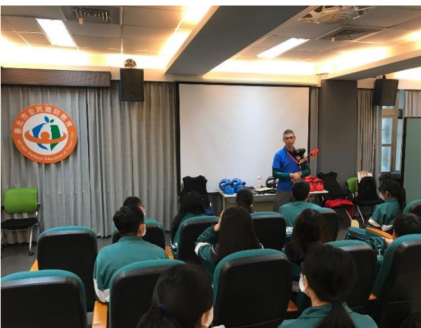
漆彈對抗融入交安守則(建立安全空間概念)