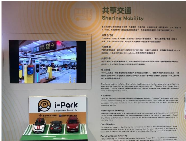
共享交通(機車、自行車、汽車、車位)