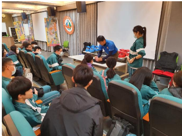
以撲克牌魔術讓同學找出安全防護守門員