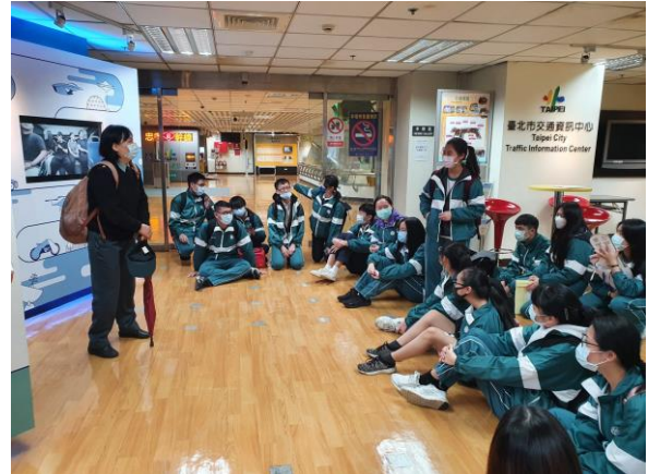
同學口頭發表心得 2