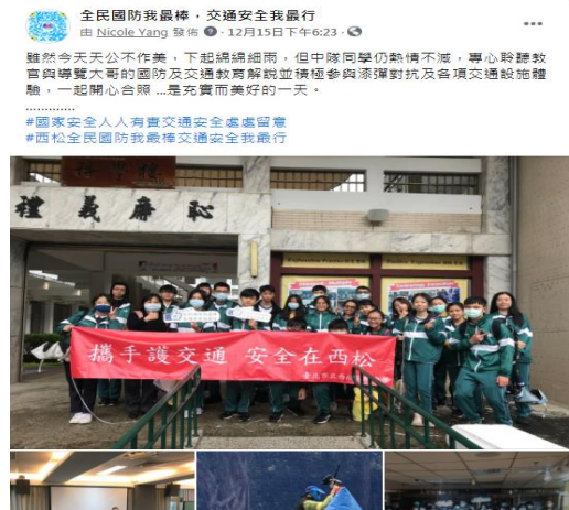
粉絲專頁分享活動