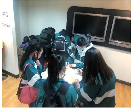
分組討論及回饋單填寫 2