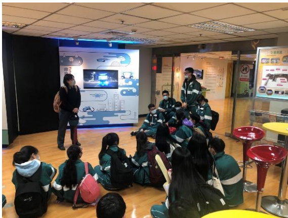
同學口頭發表心得 1