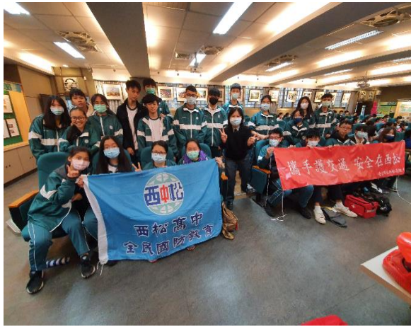
全民國防資源中心大合照