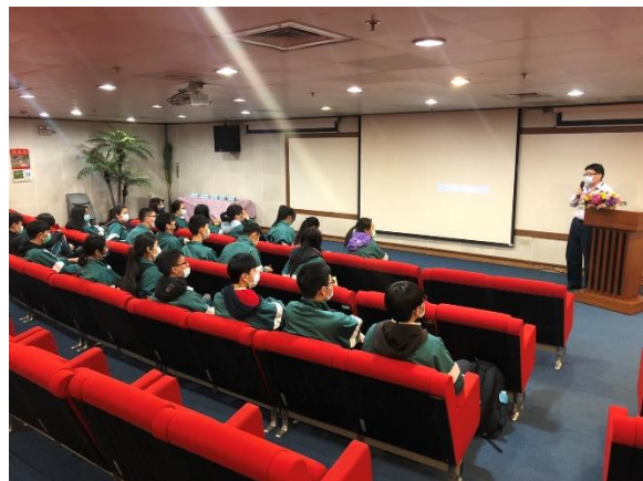
導覽員介紹交安資訊中心