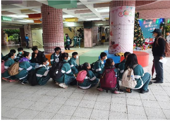
行前說明國家、社會、個人及交通安全關聯