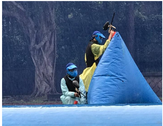
漆彈對抗融入交安守則(建立安全空間概念)