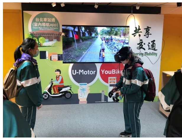
共享交通 VR 體驗