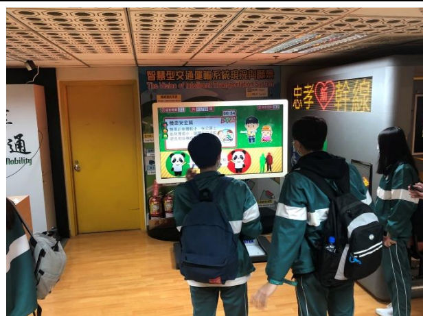
同學熱烈參與互動遊戲(機車安全)