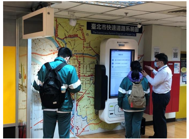
導覽員大眾運輸系統解說及即時訊息操作