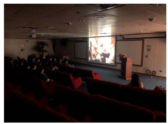
同學專心觀看交通安全教育影片