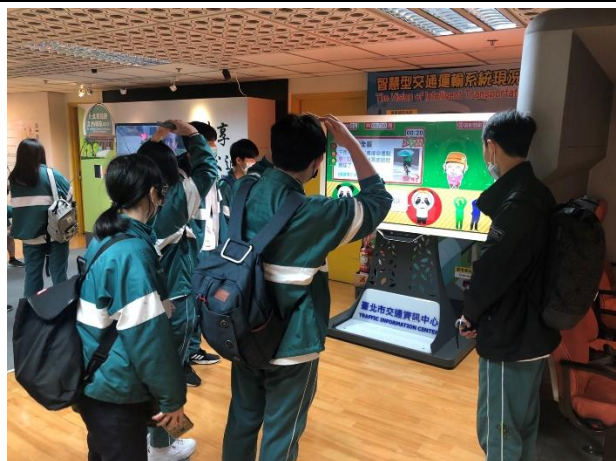
同學熱烈參與互動遊戲(自行車安全畫圈)