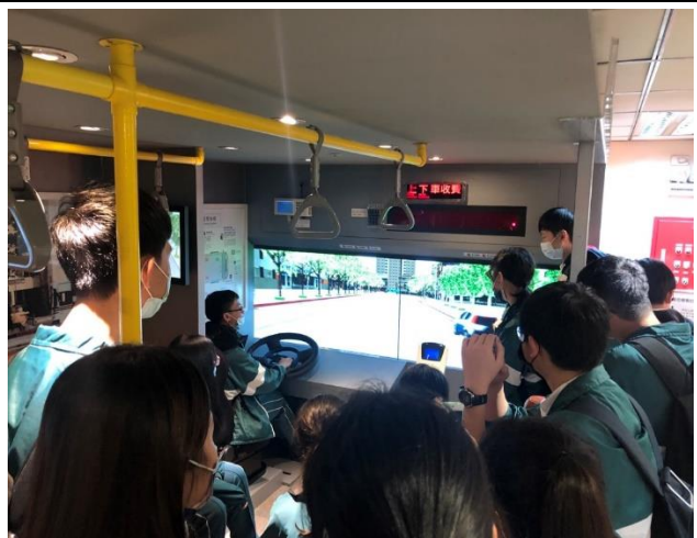
實際體驗大眾運輸工具