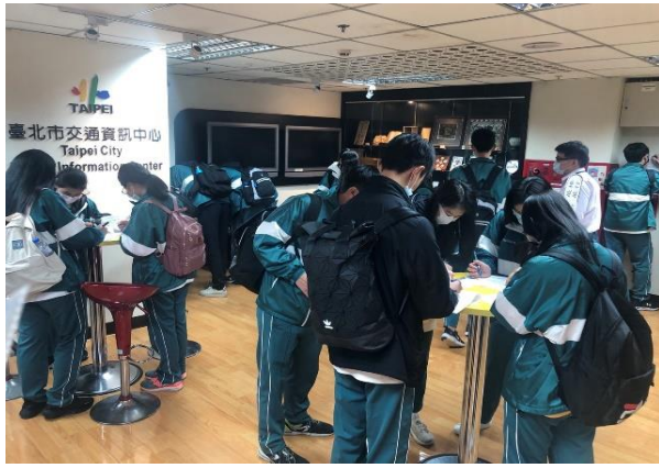
分組討論及回饋單填寫 1