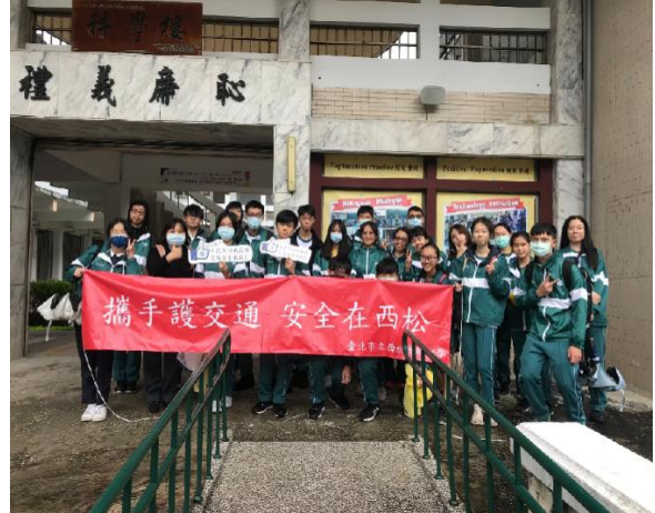
全民國防資源中心大合照