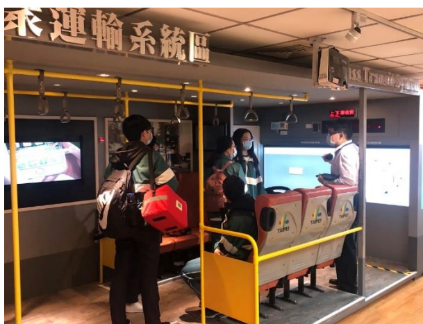
導覽員大眾運輸系統區解說