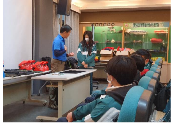
以撲克牌魔術讓同學找出安全防護守門員