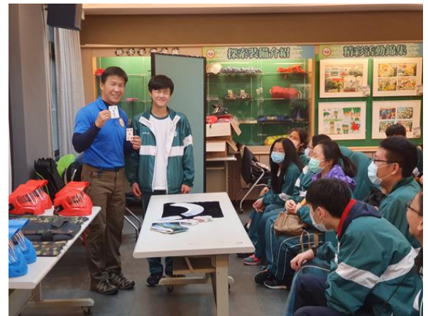
個人的通報責任(113 家暴、110 交通事故)