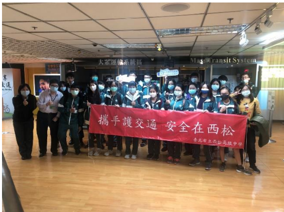
導覽員與同學們開心大合照