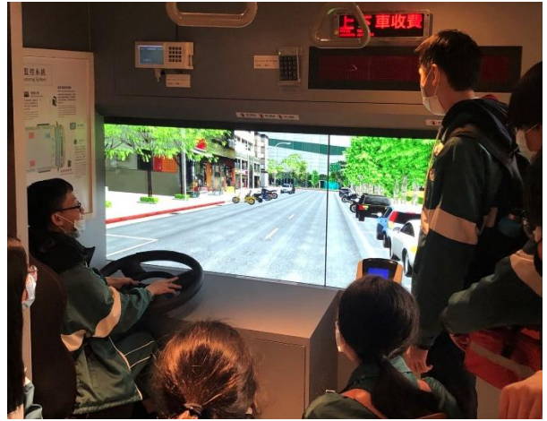
大客車的視野死角