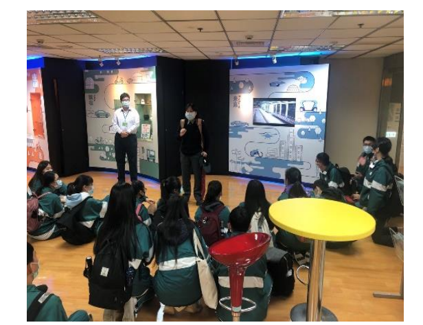
導覽員與同學們互動(Q&A)時間