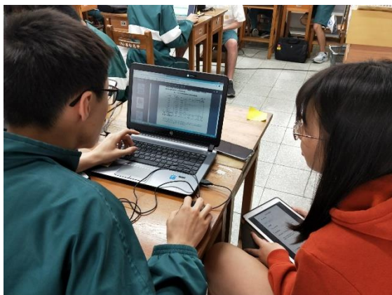
小組討論製作圖表