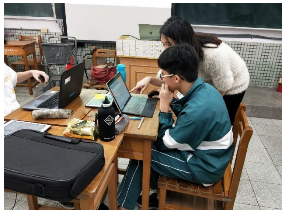
老師解答學生疑問