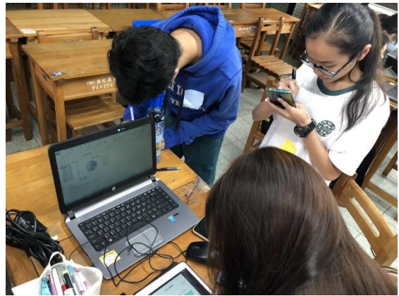
小組討論製作圖表