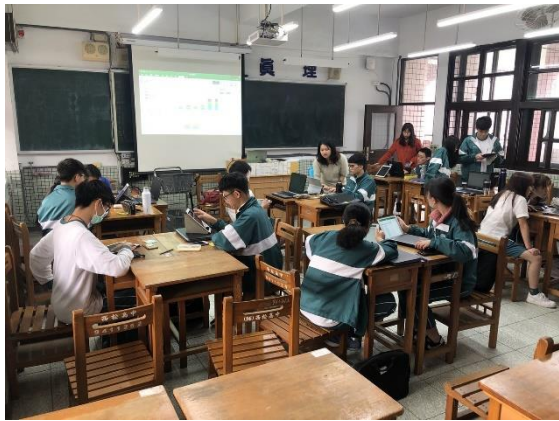
小組討論製作圖表