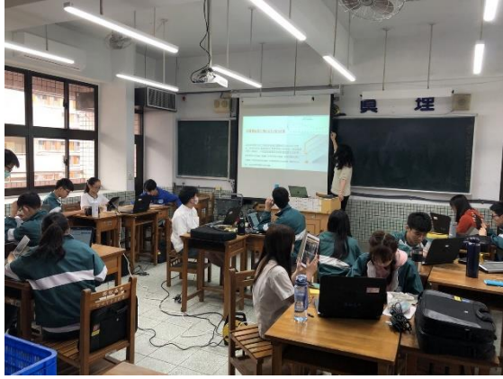
講解交通事故肇事率數據化