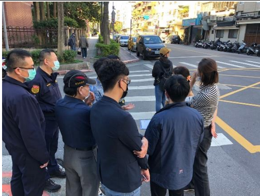
共同會勘校園周邊硬體改善事宜