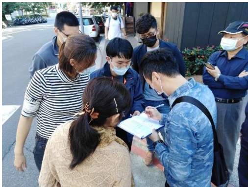
共同會勘校園周邊硬體改善事宜