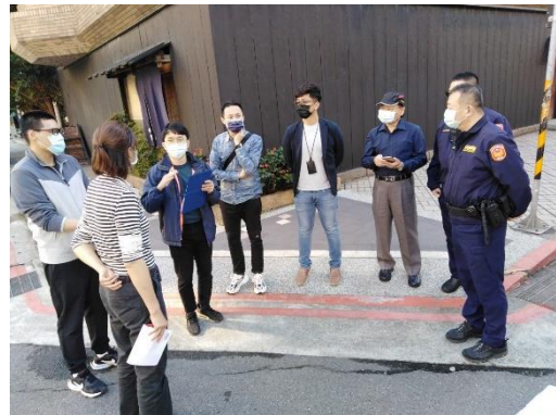
共同會勘校園周邊硬體改善事宜