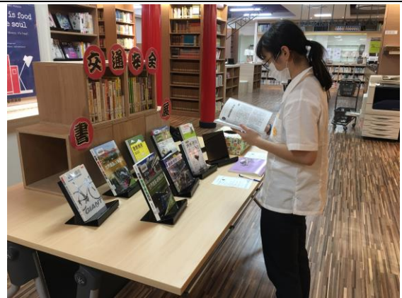
同學閱讀交通安全相關書籍