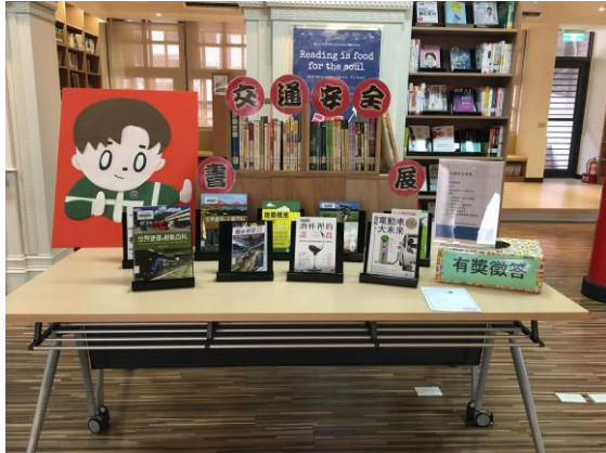
圖書館舉辦交通安全書展活動