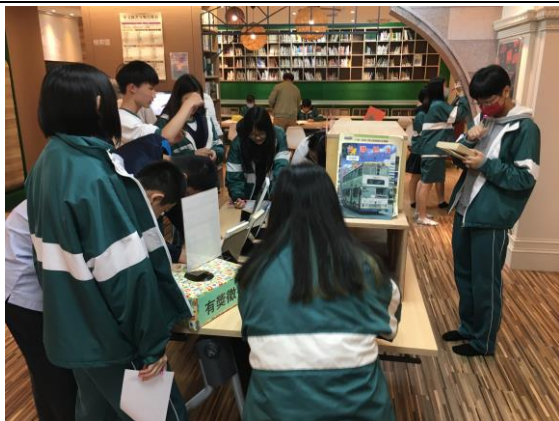
同學於現場參與有獎徵答活動