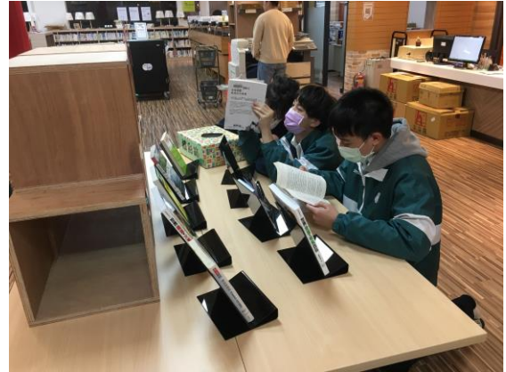
同學踴躍參與活動