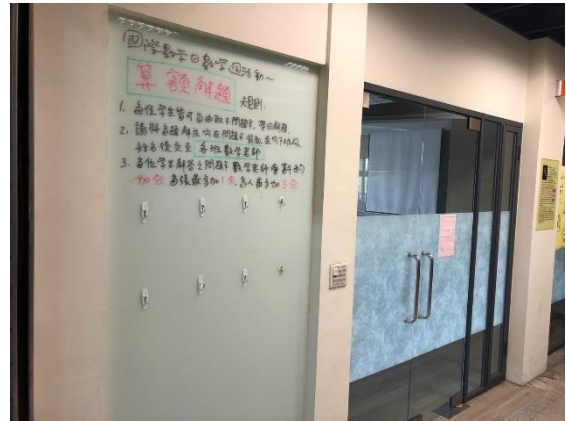
高斯教室前公布活動資訊