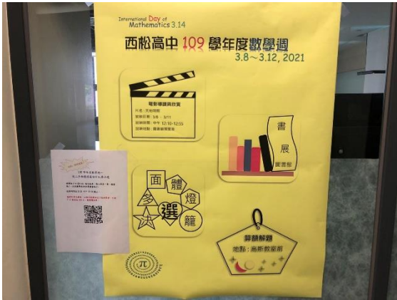
國際數學日-數學週