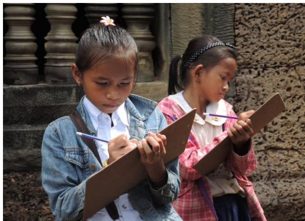
(孩子們認真的畫畫寫生)

最後一天的吳哥窟，雖然帶著小孩其實沒什麼時間好好看看好好拍照，但是我看到的是，他們多認真在聽著自己國家的歷史甚至作筆記，多認真的在畫畫，到了分享時間，我的兩個孩子們把她們的畫送給我，說我像美人魚跟女主角一樣漂亮，真的很感動。最後送他們回學校時，我的其中一個小孩說，他今天學到了這麼多自己國家的歷史，他會好好念書，讓世界更多人看到屬於他們的國家，我很驚訝一個小學生能說出這樣的話，這麼的發人深省。