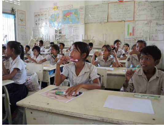
(孩子們認真地聽著如何正確刷牙)

最讓我印象深刻的是，當我們到了一個孤兒院，裡面大概30多個小孩，最小的大概只有3歲，我媽媽是保母，家裡很多小孩，所以當我看到他們時，心情真的很複雜，突然一陣大雨又急又快，所有小孩一下子全跑出去，為了收那個曬在園區另一頭的衣服，突然一個很小的身影竄過我身邊衝了去，是最小的那個孩子，看著他跑到那一頭，在哥哥姊姊身邊著急地轉來轉去，可是他太小了，只拿了一件衣服，披在身上，一步一步跑回來，即使每一步看起來都快跌倒了還是用那小小的步伐奮力往前，那是我這幾天來看到最震撼的一個畫面。