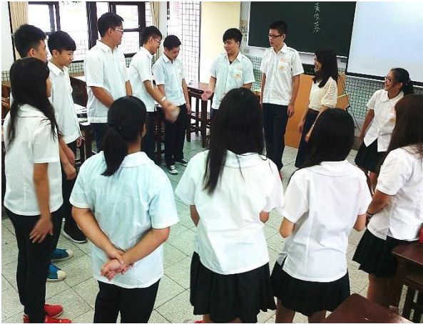
第一堂課 認識活動與課程介紹