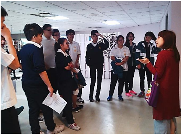
參訪公共電視台_新聞自由與言論自由