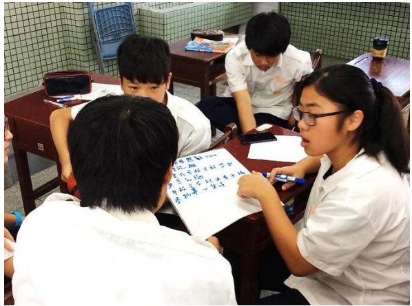
人權議題的分組討論與分享