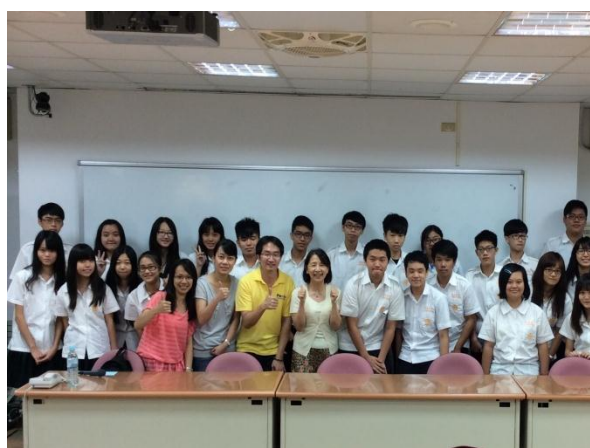
公共電視 Peopo 平台講座_校長也一同聆聽公民記者的意義與掌鏡實務分享