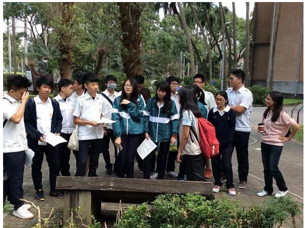
參訪台大_校園人權議題探究