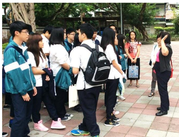
參訪大稻埕_二二八事件及人權史蹟