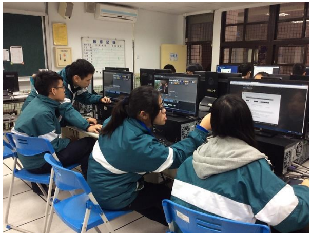
期末小組短片報告的分組多媒體剪輯實作