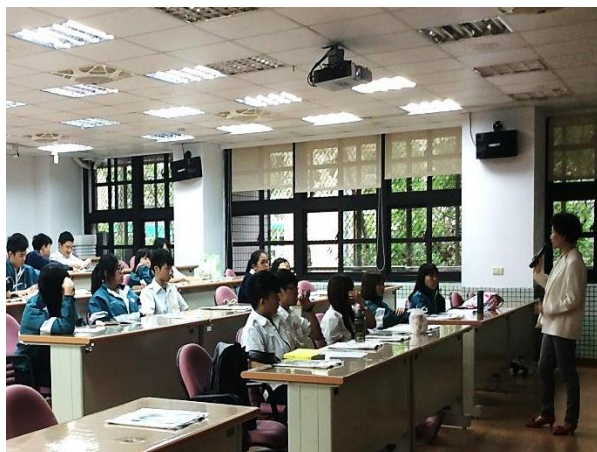
我國人權歷史背景及概況講座