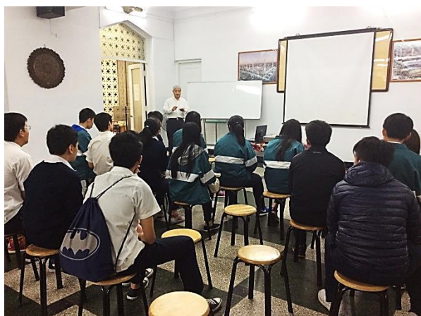
參訪台北清真寺_宗教信仰自由及伊斯蘭教的神秘面紗認識