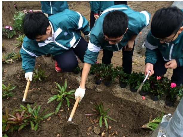
寶清公園入口花園植栽施作