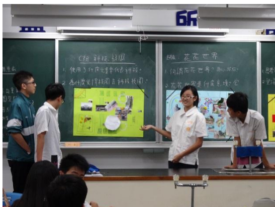
學生上台分享重新拼貼後的校園新意象。