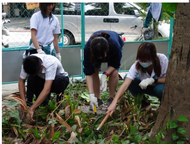
寶清公園入口花園植栽規劃前置作業