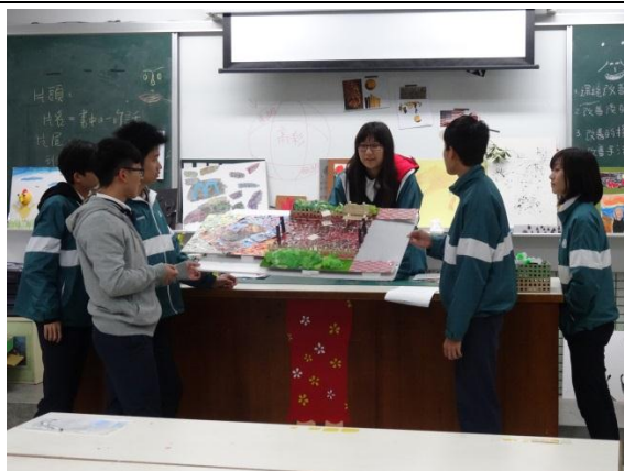
學生透過自製模型，分享西松公園角落構構想