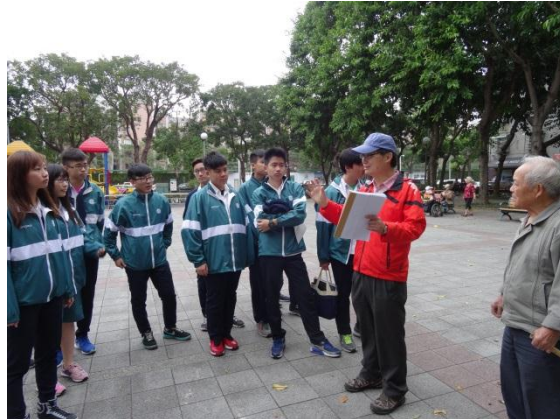
里長導覽與解說社區環境