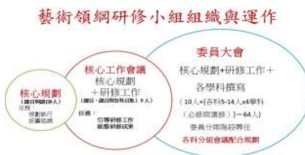
圖 2: 藝術領綱研修小組組織與運作

本研修小組自 103 年 6 月正式運作以來，總計召開 9 次「全體委員會會議」，12 次「核心工作會議」，26 次音樂小組會議，35 次視覺藝術/美術小組會議，18 次表演藝術小組會議，8 次藝術生活科小組會議。