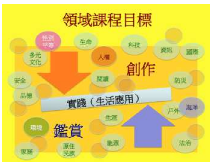
圖 4 藝術領域課程目標主軸：表現、鑑賞、實踐

課程目標的設定，係基於藝術學習的核心本質，也是歷年我國各教育階段藝術學習的課程核心主軸，即探究由「作品」、「藝術家」、「觀者」三者所共譜的藝術世界，及其與外在社會文化脈絡的關係，其中，有關個別或互動所產生之各項議題與意義的了解。換言之，是環繞「表現」、「鑑賞」、「實踐」等三構面的學習。其中，「表現」是善用媒材與形式從事藝術創作與展現，傳達思想與情感；「鑑賞」是透過感受與理解參與審美活動，體認藝術價值；「實踐」則是培養主動參與藝術的興趣與習慣，促進美善生活。至於這三構面的學習，是在社會文化下的情境，必然與當代重大的議題密切相關，如圖 4。