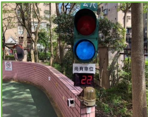
圖 11 地下停車場車位電子計數器

(四)學校交通糾察服務隊由高一各班輪流進行輪值，每次輪值為期兩週，除維護交通安全外也提供學生服務學習的機會。