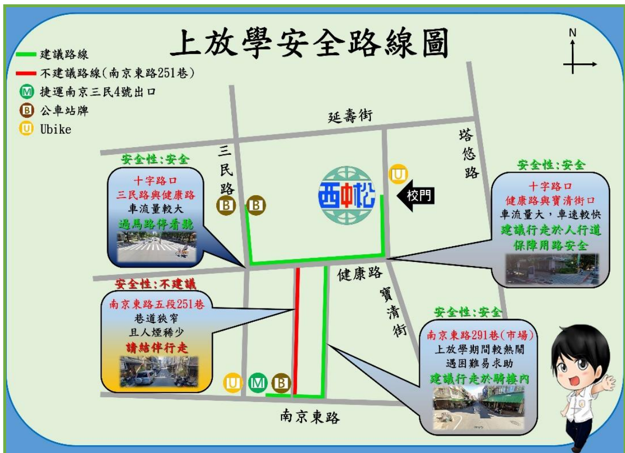
圖 3 本校學生上放學安全路線圖

本校學生使用之交通工具最多為捷運(50%)，公車次之(21%)，學校位置鄰近南京東路五段，搭乘捷運者從南京三民站 4 號出口步行至學校，搭乘公車者多數於三民路西松高中公車站牌下車步行至學校，因此學校規劃學生上放學安全路線如圖 3。