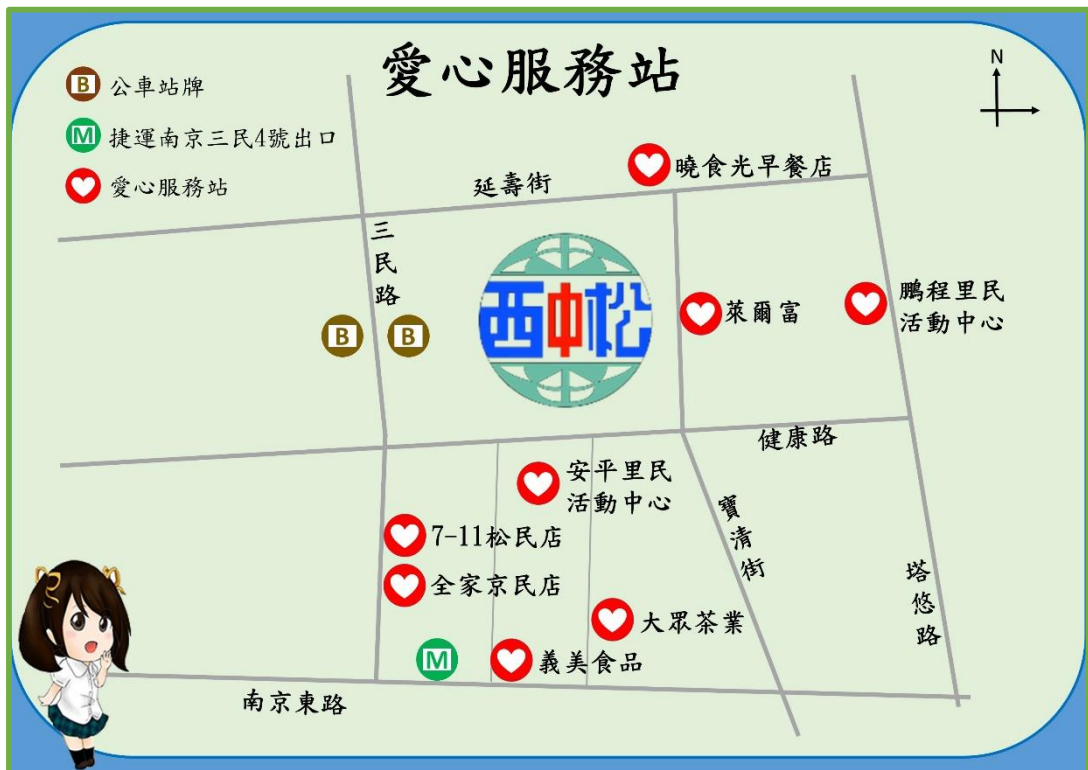
圖 7 學校周邊道路暨愛心服務站示意圖

本校位於健康路及延壽街之間巷道，校門右側為健康路與寶清街，校門左側為延壽街。健康路為雙向四線道，屬一般道路；延壽街為雙向兩線道，車流量普通。本校四周皆設有人行道，用路人行走有保障。本校與公車站、捷運站附近商家策略聯盟，合計有 8 家愛心服務站。學校周邊道路及愛心服務站如圖 7 所示。