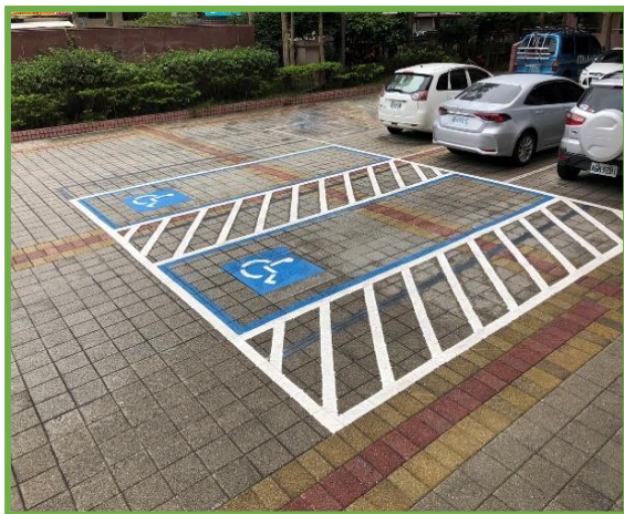
圖 1 本校無障礙停車位