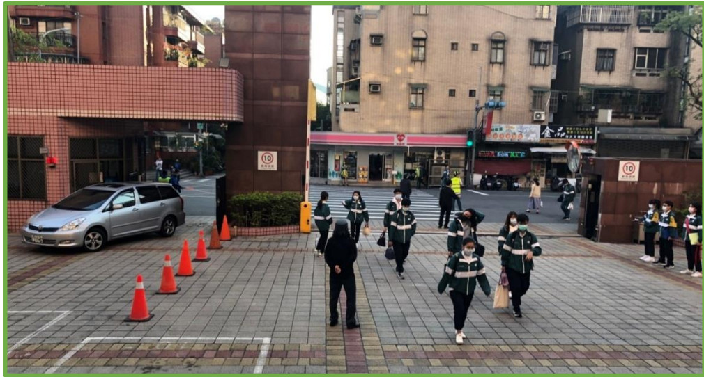
圖 6 校門口上學時間落實人車分道