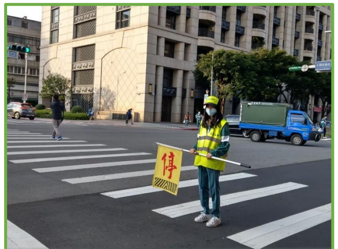
圖 12 服務學習-交通糾察服務隊