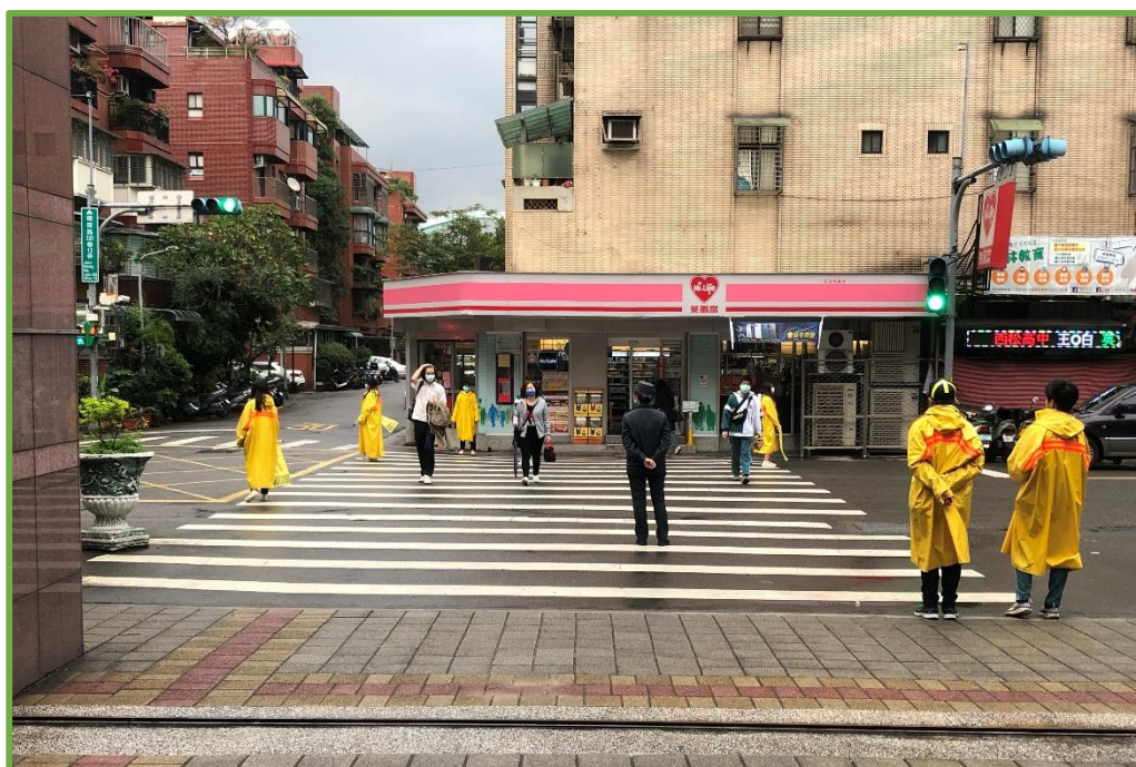
圖 5 校門口教官與交通糾察服務隊執行交通導護

本校於學生上放學時段落實執行人車分道，師生皆由學校大門進出，車輛則由側門進出。上放學時段皆有教官於校門口站崗導護，維護用路安全。上學情景如圖 5、圖 6 所示。