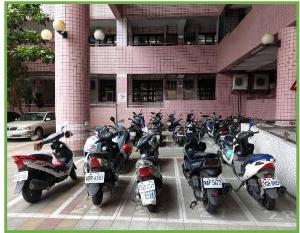
圖 2 本校機車停車位