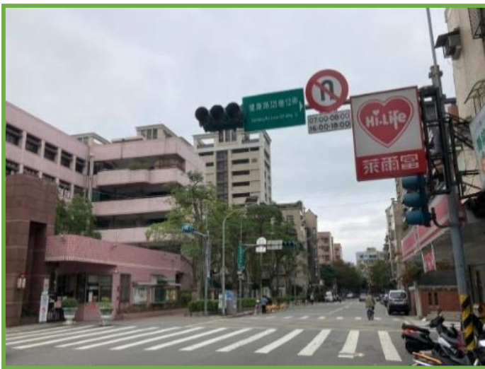
圖 8 校門前增設時段性禁止迴轉標誌

(一)為提升學生用路安全，本校已與交工處、鵬程里長於 109 年 12 月 2 日進行健康路 325 巷校門口與健康路 325 巷 5 弄路口會勘增設標誌、號誌之可行性， 325 巷校門口 因常有駕駛人於上放學時段直接迴轉，造成學生用路風險，已請交工處協助完成 增設時段性禁止迴轉標誌 。 325 巷 5 弄路口 則為步行學生常通過路口，為確保學生用路安全，已於 110 年 3 月 5 日與交工處、鵬程里長完成會勘，確認將於 110 年 7 月 增設紅綠燈交通號誌 。