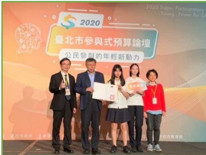
圖 10 本校學生參與式預算論壇提案榮獲優選

(二)本校學生參與 109 年參與式預算提案，學生發現南京東路五段 251 巷巷道狹窄，且人行道僅畫設一半，故提案延長巷道內之人行道，以達成人車分道不爭道，保障行人用路安全，本提案獲得優選肯定。